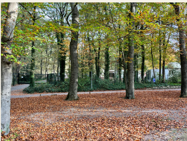
Aan je rechterhand tref je een groot groen hek