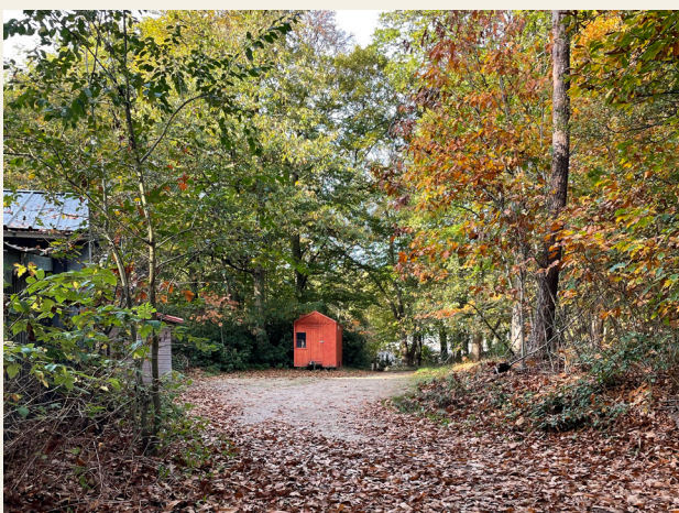
Tweede parkeerplaats na 125m links