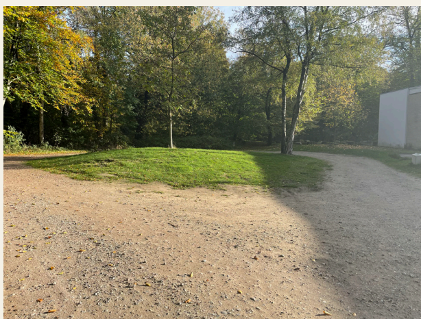
Derde parkeerplaats achter het hoofdgebouw