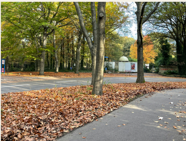
Aanzicht entree Museumpark Orientalis