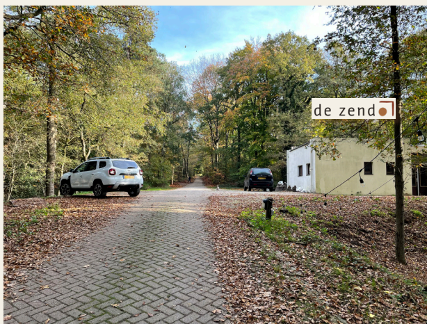
Eerste parkeerplaats bij De Zendo